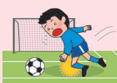
● 団体活動中のケガ

※AW・BW・CW区分にご加入の場合は、上記に加え、「団体での活動中およびその往復中」以外の事故も対象となります。ただし、熱中症、細菌性・ウイルス性食中毒を除きます。