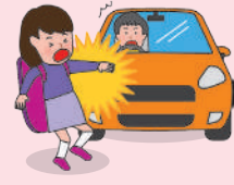
● 団体活動への往復中、車にはねられてケガをした場合